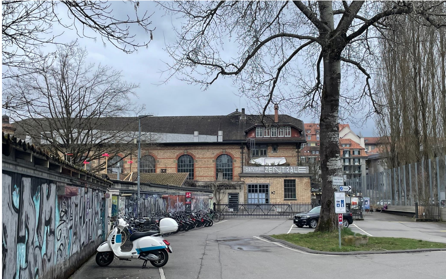
Am Ende der Strasse befindet sich die Dampfzentrale. Hier hat es Autoparkplätze und eine Publi-Bike-Station auf linker Seite.