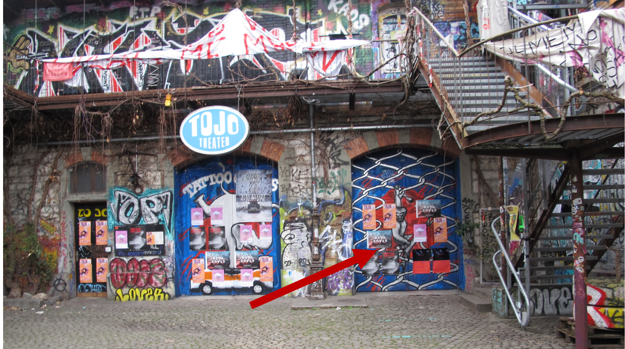
Die Türe des Tojo Theaters befindet sich auf der rechten Seite. An der Tür hängt ein Plakat von auawirleben mit der rosaroten Aufschrift NONETHELESS.