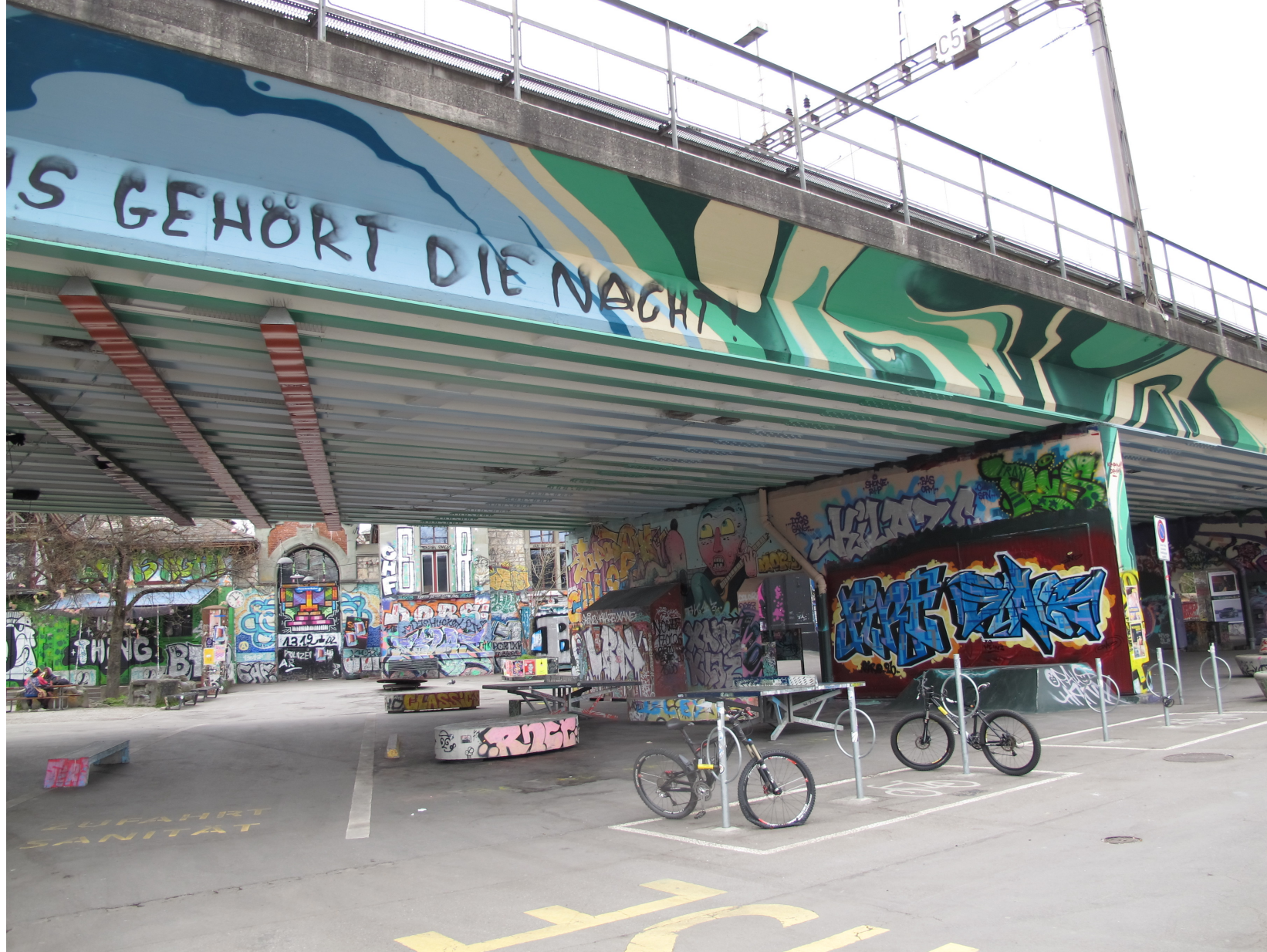
Unter der Brücke vor dem Gebäude hat es Veloparkplätze. Hier kannst Du dein Velo abstellen.