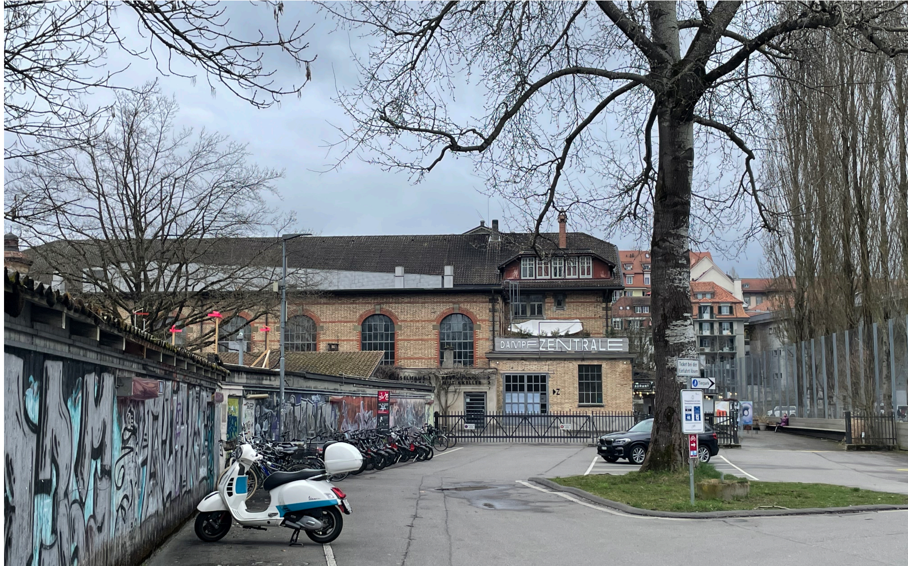
Am Ende der Strasse befindet sich die Dampfzentrale. Hier hat es Autoparkplätze und eine Publi-Bike-Station auf linker Seite.