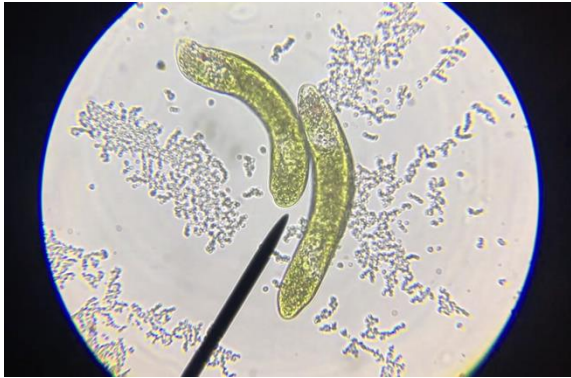
Abbildung 5: « Microbial Sights - Cinema » von Britt Bakker (©Britt Bakker)

und präsentieren sie im Programm von auawirleben , selbstverständlich transparent gekennzeichnet, wie die Einladung zustande kam. So lud dieses Jahr die Gruppe Ontroerend Goed die Künstlerin Britt Bakker ein. Sie schuf eigens für Bern ein Projekt namens Microbial Sights , in dem sie das Publikum auf eine Sightseeing-Tour durch die mikrobiellen Welten in der Reitschule nahm. Als zweite Produktion im Format «Bring A Friend» luden wir das Stück « Apparitions » von Diederik Peeters ein, welches von Antoine Defoort nominiert wurde. Dies ist eine derjenigen Produktionen, deren Premiere ungeschickt in die Pandemie fiel, wodurch sie nur wenig Aufmerksamkeit erhielt. Hier konnte das Format also ein bisschen Abhilfe schaffen.