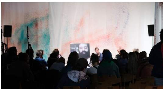
Abbildung 13: Wissensaustausch «Nachhaltig unterwegs - Neue Wege der Mobilität in der Kultur»

Neben unseren üblichen Bestrebungen, das Festival und unseren Arbeitsalltag umweltverträglicher zu gestalten (z.B. in den Bereichen Reisen, Catering und Werbung) organisierten wir dieses Jahr gemeinsam mit dem ISC Club Bern und dem Verein Vert le futur einen Wissensaustausch mit dem Titel «Nachhaltig unterwegs – neue Wege der Mobilität in der Kultur».