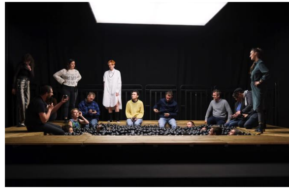
Abbildung 8: «Les Thermes» von France Distraction

Ausserdem war während dem ganzen Festival die Installation «Les Thermes» besuchbar. Das Projekt besteht aus einem riesigen Bällebad für Erwachsene, in dem man wortwörtlich in den Theorien der Stoiker schwimmt. Neben dem kontemplativen «freien Baden», gab es Inputs von ganz unterschiedlichen Menschen, welche das Festivalthema mit den stoischen Gedanken verbanden. Ein zweites durchgehendes Element waren die «Sprechstunden» von splatz.space. Das Berner Online-Magazin protokollierte Gespräche mit den Besucher*innen des Festivalzentrums, täglich zu einer anderen Leitfrage. So entstand eine Art Tagebuch des Festivals auf der Website www.splatz.space (links oben kann nach auawirleben gefiltert werden).