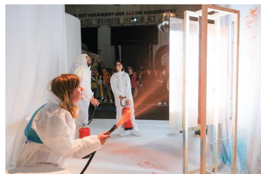
Abbildung 6: Festivalzentrum von Ortreport

Zum zweiten Mal konnten wir das Team von Ortreport aus Zürich für die Gestaltung des Festivalzentrums gewinnen. Ortreport hatte die schwierige Aufgabe, die unterschiedlichen Raumnutzungen, das Festivalthema und eine attraktive Gestaltung zusammenzuführen. Sie entwickelten eine geniale Raumaufteilung durch in geschwungenen Bögen aufgehängte Vorhänge. Zusammen mit dem Mobiliar der Festival-Beiz wurden diese während der Festivaleröffnung performativ mit Farbe besprayt. So war es möglich, in diesem grossen Raum gemütliche Bereiche zum Essen zu schaffen, aber ebenso einen offenen Bereich für Podiumsdiskussionen oder als Dancefloor,