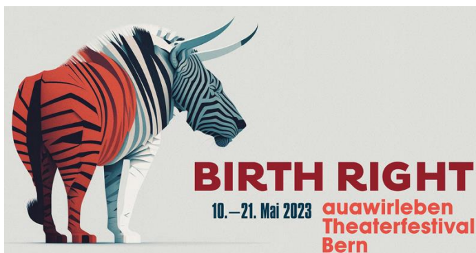
Abbildung 1: Unser diesjähriger Claim «Birth Right»

Das diesjährige Festivalthema lautete «Birth Right». Dazu aus dem Editorial des Programmhefts: