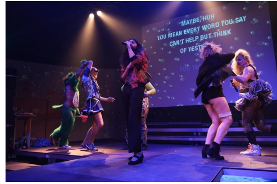
Abbildung 10: «Queereoké» im Festivalzentrum