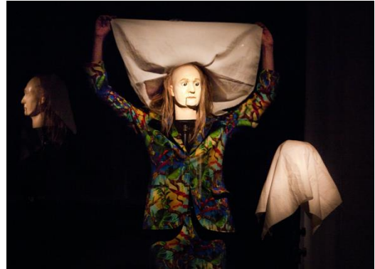
Abbildung 4: « Apparitions » von Diederik Peeters