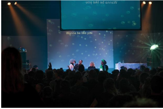
Abbildung 11: «Queereoké» im Festivalzentrum