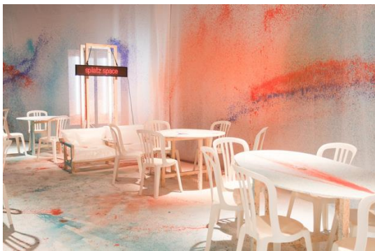
Abbildung 7: Festivalzentrum von Ortreport

Nachdem wir im letzten Jahr mit dem Waisenhausplatz und der Grossen Halle der Reitschule zwei Festivalzentren für verschiedene Tageszeiten hatten, verspürten wir dieses Jahr das Bedürfnis, uns wieder auf einen Ort zu konzentrieren. Dazu wählten wir die Grosse Halle, da sie sowohl die Vorteile eines offenen, weiten Platzes, wie auch die eines wettergesicherten Innenraums mitbringt.