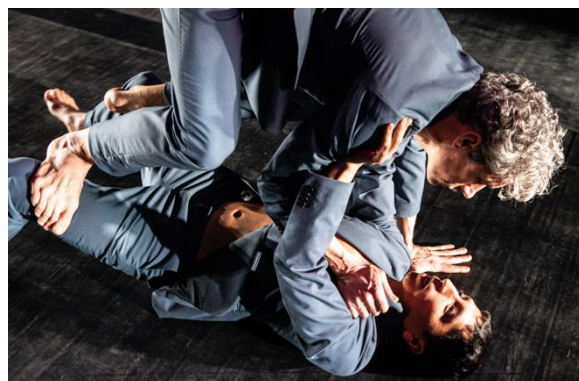
Abbildung 2: «Dos Vidas.Zwei Leben» von KLARA Theaterproduktionen