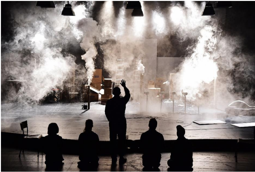
Girl From The Fog Machine Factory

die Krawalle am Vorabend auf den Strassen um die Reitschule herum gewesen sein. Möglicherweise hielten die Nachrichten am Tag darauf einige Familien vom Besuch ab.)