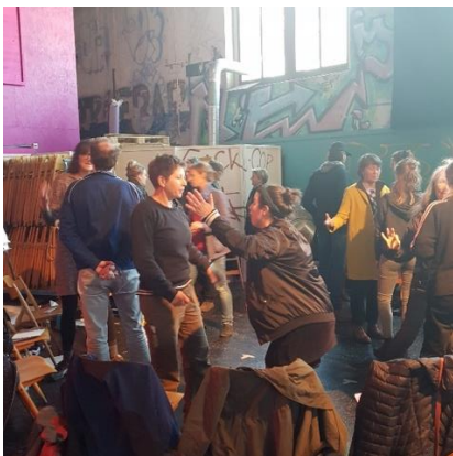
Crashkurs Argumentieren gegen Stammtischparolen

Mit unserem Rahmenprogramm verfolgten wir dieses Jahr zwei Stränge weiter, welche uns bereits in den vergangenen Jahren zunehmen interessierten: das Angebot von Crashkursen zu passenden Themen und die Weiterentwicklung des Formates des Publikumsgespräches. Die Crashkurse zu kommunikationsrelevanten Themen (Gebärdensprache, gendergerechtes Diskutieren, Zivilcourage und Argumentieren gegen Stammtischparolen) zogen alle viele Teilnehmende an und wurden von viele als Bereicherung des Theaterprogramms bewertet.