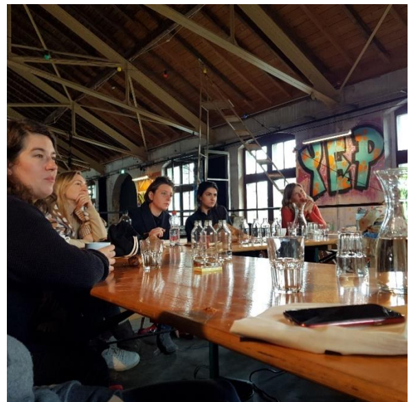
Diskussionen der Lab-Teilnehmenden

Die vierte Ausgabe von «How do you do?» wurde von den Teilnehmenden als spannend und bereichernd bewertet. Auch die Auswahlart der Teilnehmenden durch Nomination, sowie ohne Produktionsdruck über das spezifische Thema zu diskutieren zu können, wurde positiv aufgenommen. Das Thema «Representation & Appropriation» war eine Art Anker, zu dem die freien Diskussionen immer wieder zurückkehrten. Tatsächlich wurde aber noch eine verstärkte theoretische Einführung in die Thematik gewünscht, damit von einer gemeinsamen Basis aus diskutiert werden konnte.