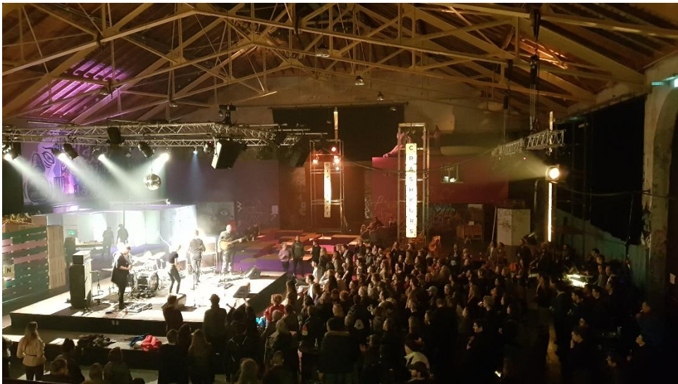
Konzert von Lia Sells Fish

Neben den Crashkursen und den Konversationen beherbergte unser XL-Festivalzentrum in der Grossen Halle aber wie auch vier Konzerte (Paradisco, Omni Selassi, Mercier & Grand, Lia Sells Fish). Mit diesen konnte das allgemeine «Ausgangspublikum» in der Reitschule und auf der Schützenmatte angesprochen werden. Da auch drei Produktionen aus dem Hauptprogramm («Worktable», «Given that», «Me, My Mouth and I» und «Crazy but True») in der Grossen Halle zu sehen waren mischten sich die unterschiedlichen Publika dieses Jahr besonders stark. Schön war, dass viele, denen aua noch eher fremd war, bei «Given that» mitmachten.